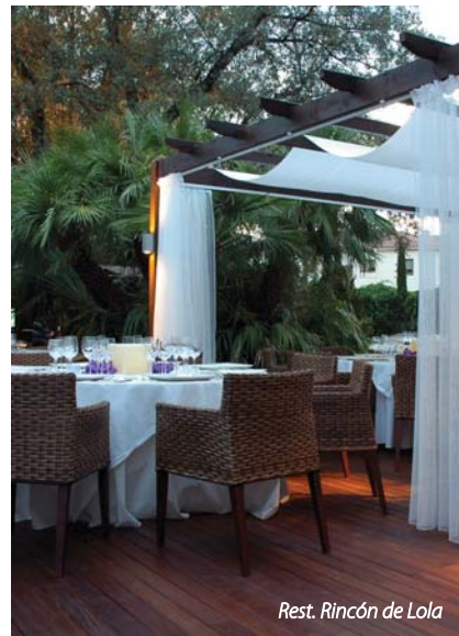
Rest. Rincón de Lola

PROGRAMAS 2 NOCHES: Especial Espalda: 1 Circuito Templarium, 1 circuito natatorium, 1 masaje terapéutico, 1 sesión de infrarrojo, 1 chorro presión. Blancafort Classic: 1 Masaje craneal, 1 masaje podal, 1 hidromasaje. Lujo Balinés: 1 Circuito Templarium, 1 circuito natatorium, 1 masaje balinés, 1 masaje de piedras. Lujo Zahir: 1 Circuito Templarium, 1 circuito Natatorium, 1 masaje ayurvédico, 1 masaje pindasweda. Especial Piernas Pesadas: 1 Masaje parcial de arcilla, 1 presoterapia, 1 ducha circular, 1 drenaje linfático. Siluetas: 1 Masaje subacuático, 2 duchas kneipp, 2 sesiones de LPG. Belleza Antiarugas: 1 Hidromasaje de perla, 1 peeling corporal de "Diamond", 1 masaje corporal con crema de "Diamond", 1 tratamiento facial antiaging "Diamond". PROGRAMAS 3 NOCHES: Belleza: 1 Drenaje facial, 1 hidrofitas, 1 peeling corporal con semilla de uvas, 1 envoltura de barro Mar Muerto, 1 hidratación corporal, 1 envoltura